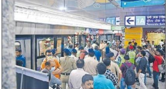
প্রথম দিন শিয়ালদহ মেট্রো স্টেশনে যাত্রীদের ভিড়। ফাইল চিব্র